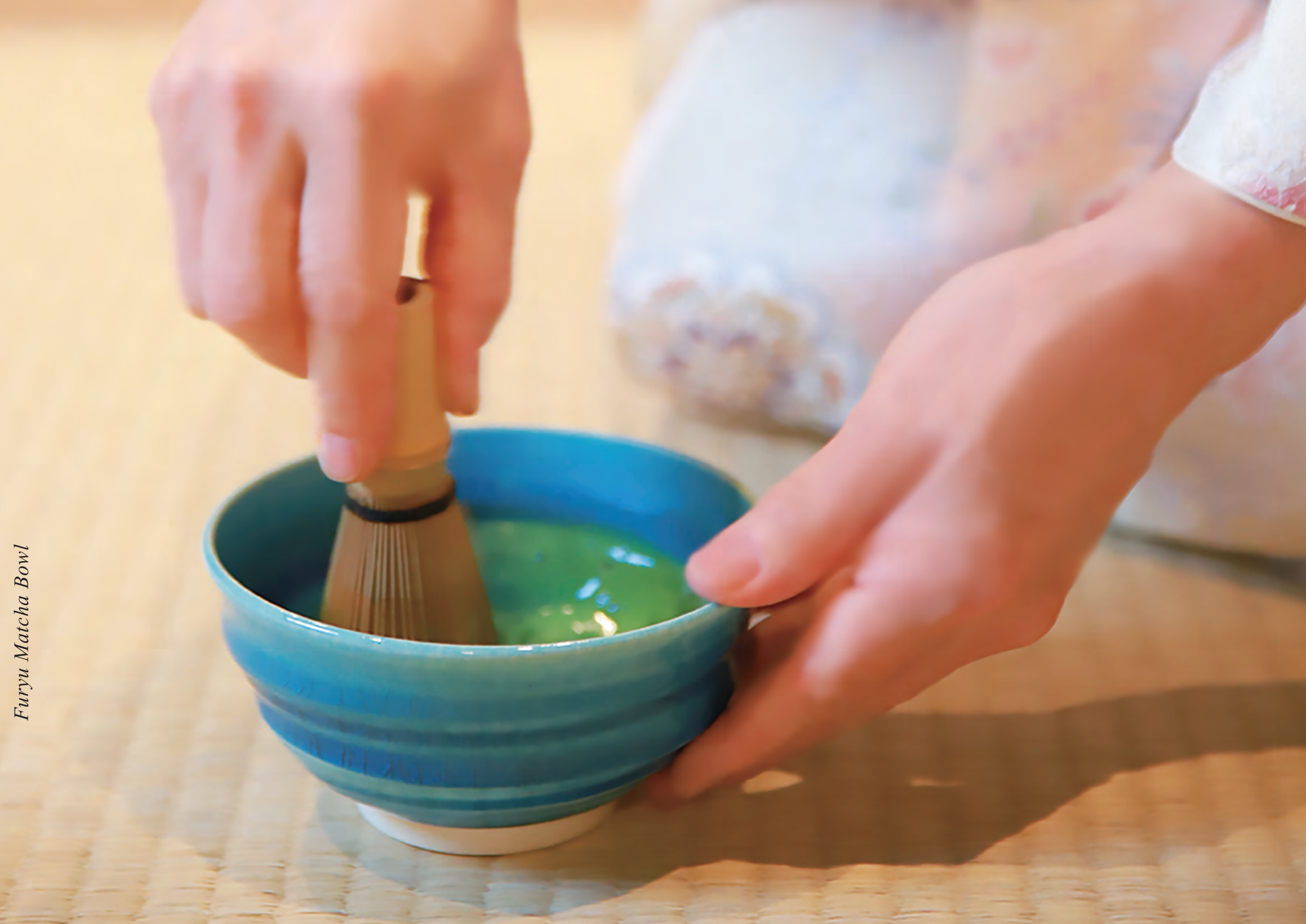
Furyu Matcha Bowl