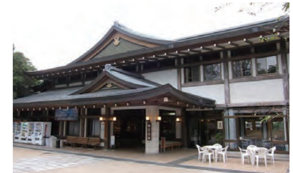
仁秀販売コーナー「御室会館」