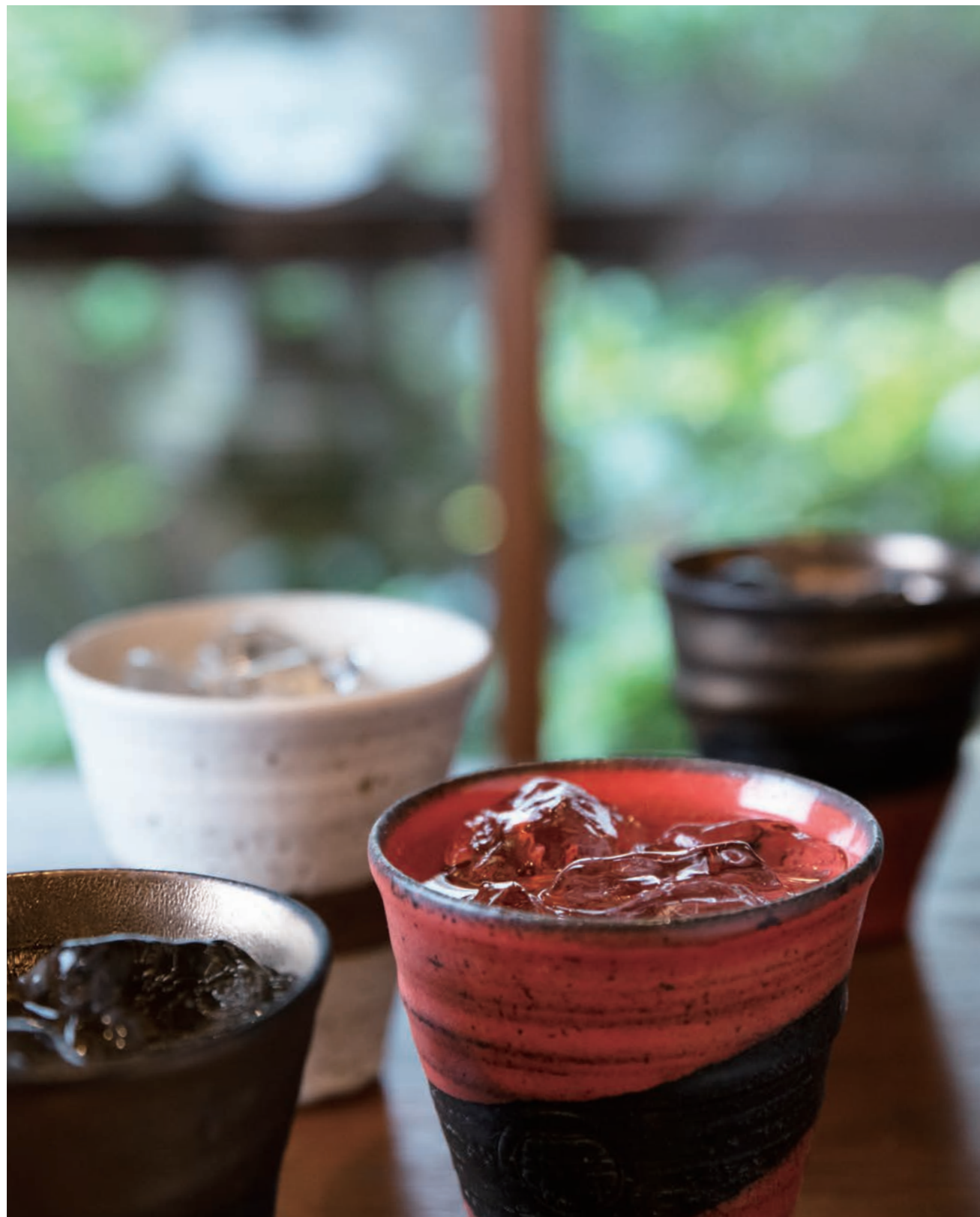
(約)直径9cm × 高さ10cm / (約)250ml approx. Diameter 9cm × Height 10cm

トニックなどのロングカクテルにも最適です。大ぶりのサイズは食卓にも映え、海外ゲストにも好評です。ひとつひとつ手づくりで、ろくろ手挽きでつくっております。