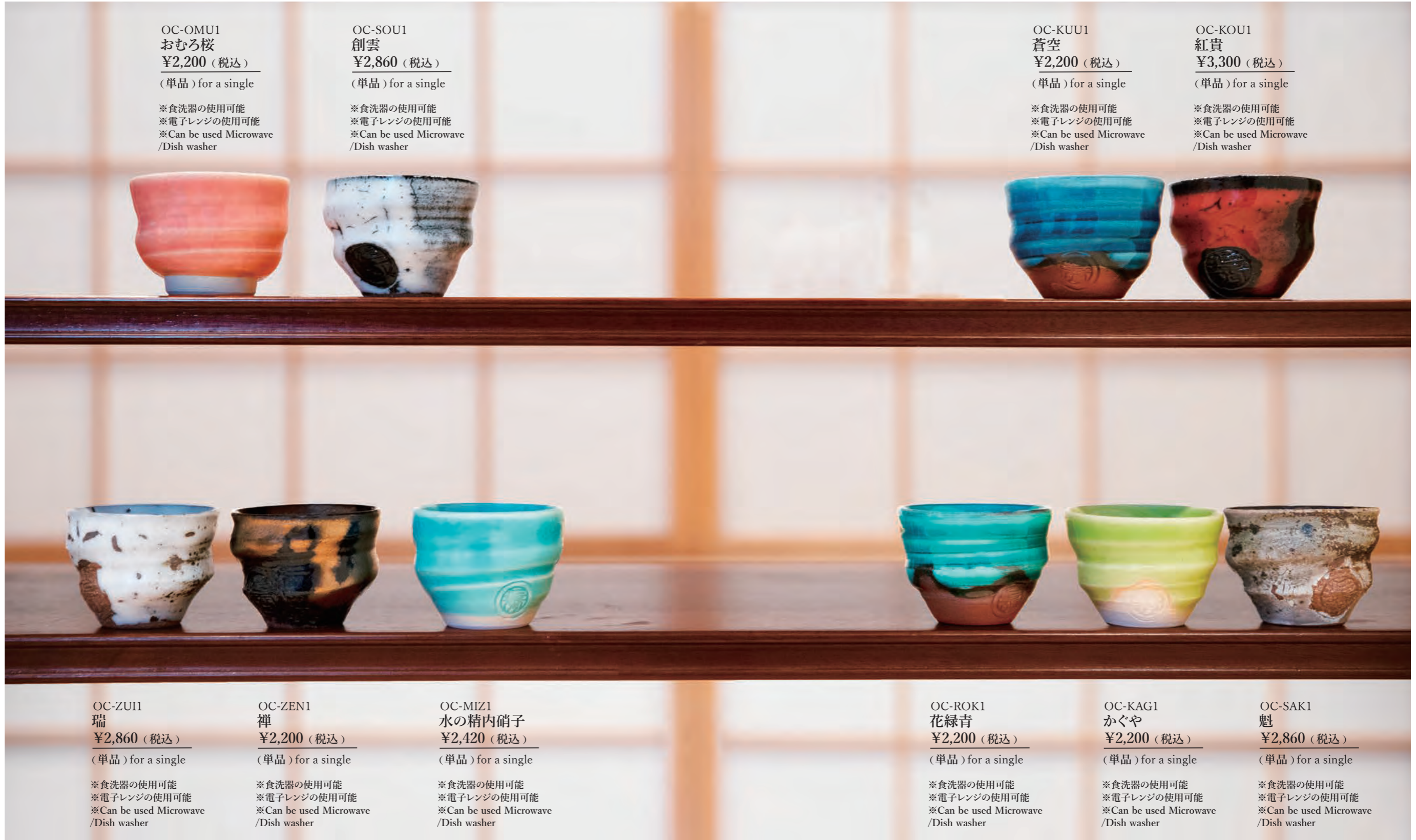
OC-OMU1 おむろ桜 ¥2,200 (税込) (单品) for a single ※食洗器の使用可能 ※電子レンジの使用可能 ※Can be used Microwave /Dish washer

(約)直径 6cm × 高さ 4.5cm / (約)60ml approx. Diameter 6cm × Height 4.5cm