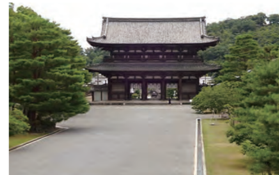
公式 HP http://www.ninnaji.jp

Welcome to Ninna-ji, the world heritage site in Kyoto.